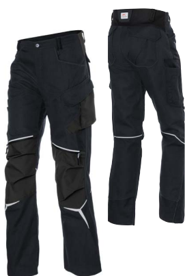
Schwarz 2125 5302-99