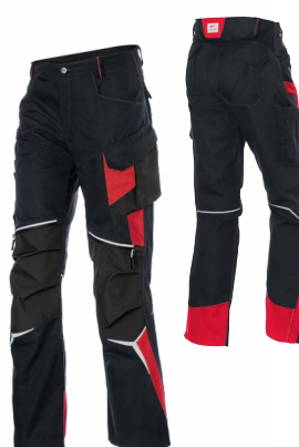
Schwarz | Mittelrot 2125 5302-9955