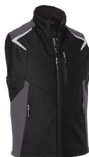
Schwarz | Anthrazit 7125 5375-9997 XS-4XL