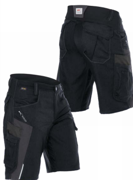
Schwarz 2425 5302-99 40-66