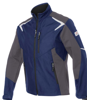
Dunkelblau | Anthrazit 1425 5375-4897 XS – 4XL