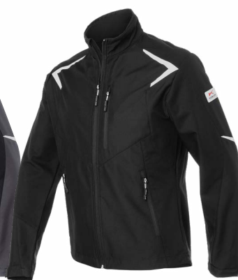
Schwarz 1425 5375-99 XS – 4XL