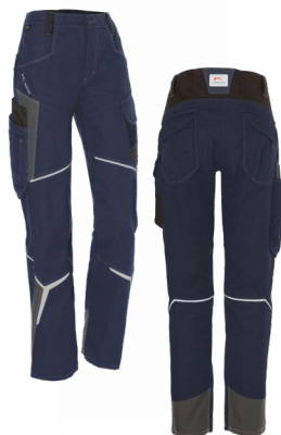
Anthrazit | Schwarz 2325 5302-9799 D34-D54