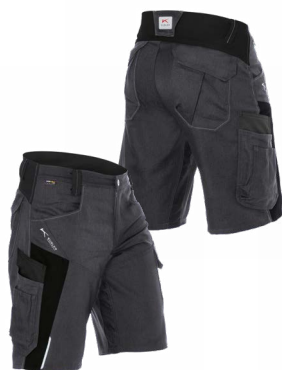
Schwarz | Mittelrot 2425 5302-9955 40-66