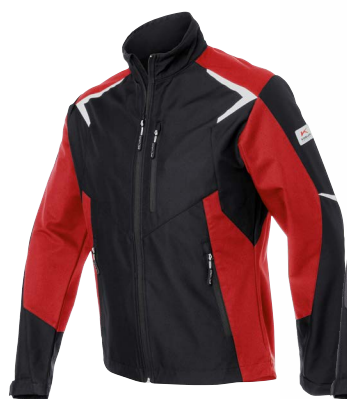
Schwarz | Mittelrot 1425 5375-9955 XS – 4XL