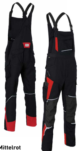
Schwarz | Mittelrot 3125 5302-9955 40-66, 90-118, 25-31