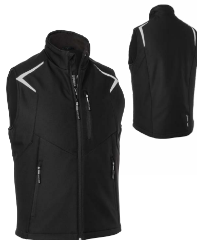
Schwarz 7125 5375-99 XS-4XL