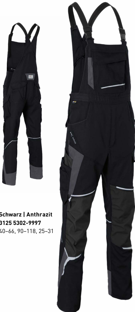
Schwarz | Anthrazit 3125 5302-9997 40-66, 90-118, 25-31