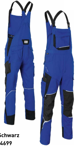
Kbl.blau | Schwarz 3125 5302-4699 40-66, 90-118, 25-31

Industriewäsche geeignet nach EN ISO 15797