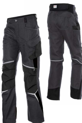
Anthrazit | Schwarz 2125 5302-9799