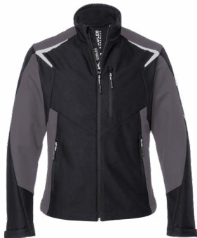
Schwarz | Anthrazit 1625 5374-9997 XS - 4XL