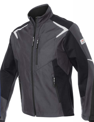
Anthrazit | Schwarz 1425 5375-9799 XS – 4XL