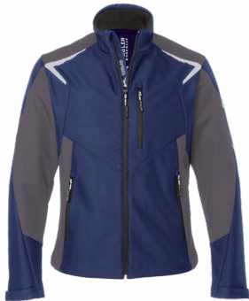
Dunkelblau | Anthrazit 1625 5374-4897 XS - 4XL