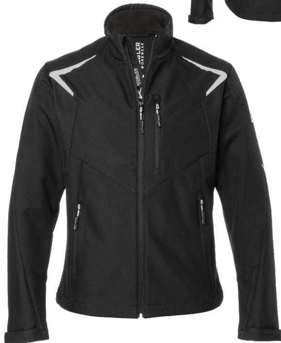
Schwarz 1625 5374-99 XS - 4XL