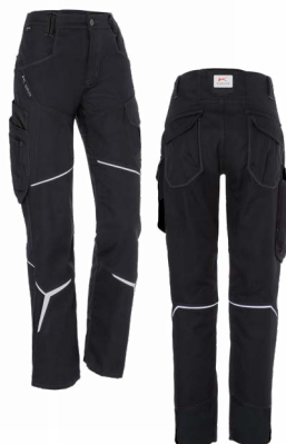
Schwarz | Mittelrot 2325 5302-9955 D34-D54