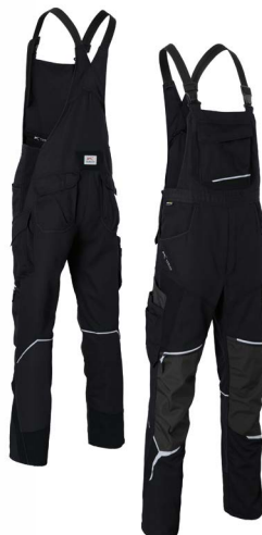
Schwarz 3125 5302-99 40-66, 90-118, 25-31