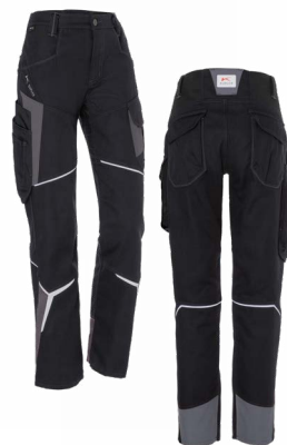
Schwarz 2325 5302-99 D34-D54