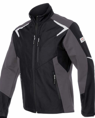
Schwarz | Anthrazit 1425 5375-9997 XS – 4XL