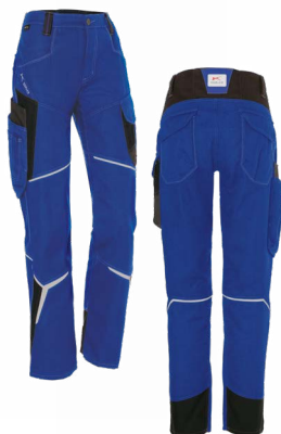
NEU Dunkelblau | Anthrazit 2325 5302-4897 D34-D54