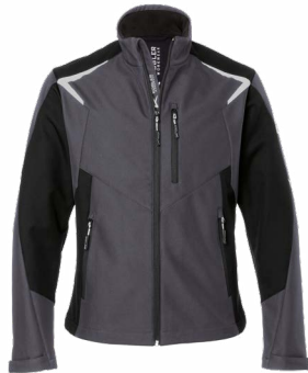
Anthrazit | Schwarz 1625 5374-9799 XS - 4XL