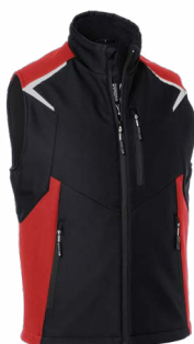
Schwarz | Mittelrot 7125 5375-9955 XS-4XL