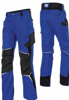
Kbl.blau | Schwarz 2125 5302-4699

Industriewäsche geeignet nach EN ISO 15797