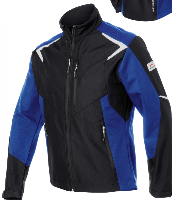
Schwarz | Kbl.blau 1425 5375-9946 XS – 4XL