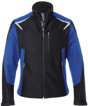
Schwarz | Kbl.blau 1625 5374-9946 XS - 4XL