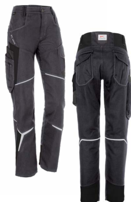
Schwarz | Anthrazit 2325 5302-9997 D34-D54