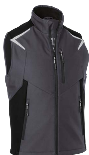
Anthrazit | Schwarz 7125 5375-9799 XS-4XL