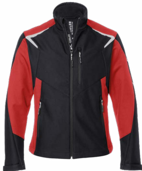
Schwarz | Mittelrot 1625 5374-9955 XS - 4XL