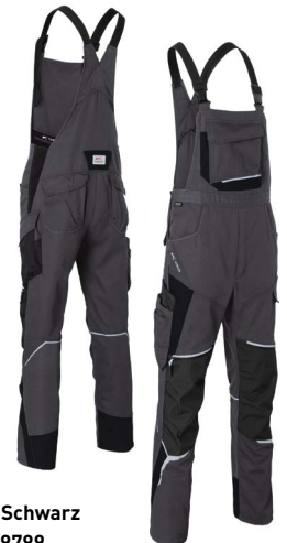
Anthrazit | Schwarz 3125 5302-9799 40-66, 90-118, 25-31