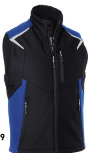
Schwarz | Kbl. blau 7125 5375-9946 XS-4XL