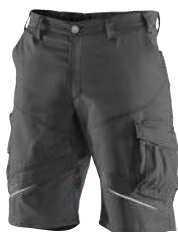
Anthrazit 2450 5365-97 40-66