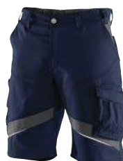
Dunkelblau | Anthrazit 2450 5365-4897 40-66