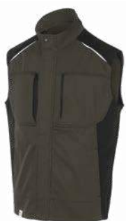
Oliv | Schwarz 7250 5365-6699 XS-4XL