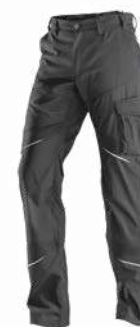
Schwarz 2550 5365-99 D34-D54