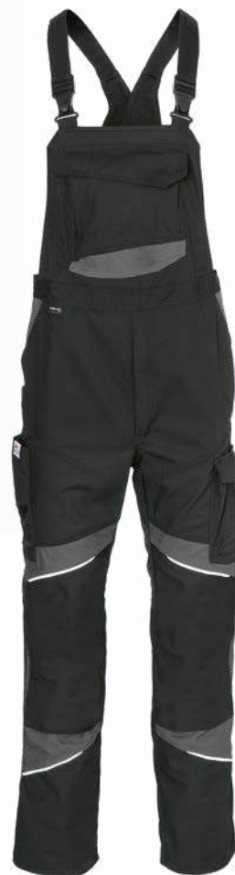
Schwarz | Anthrazit 3450 3421-9997 40-66, 90-118, 23-31