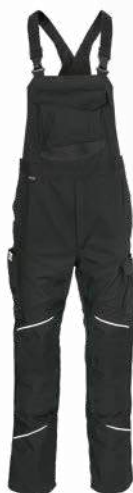
Schwarz 3450 3421-99 40-66, 90-118, 23-31