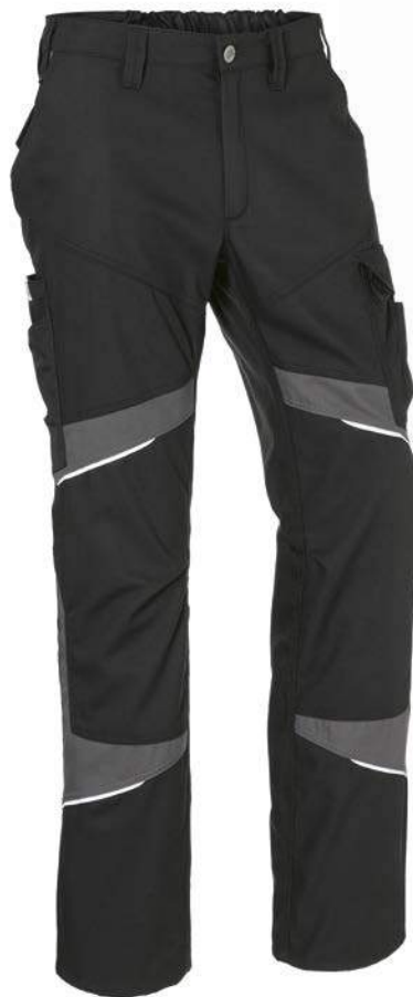
Schwarz | Anthrazit 2250 3421-9997 40-66, 90-118, 23-31