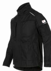
Schwarz 1250 3421-99 XS-4XL