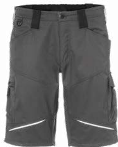
Anthrazit 2950 5231-97 40-64