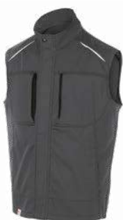
Anthrazit 7250 5365-97 XS-4XL