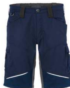
Dunkelblau | Anthrazit 2950 5231-4897 40-64