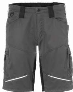
Anthrazit | Schwarz 2950 5231-9799 40-64