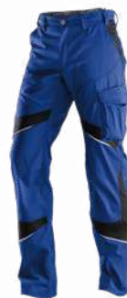
Kbl.blau | Schwarz 2550 5365-4699 D34-D54