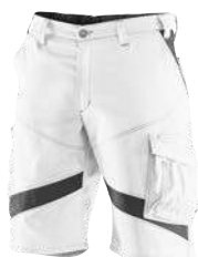
Weiß | Anthrazit 2450 5365-1097 40-66