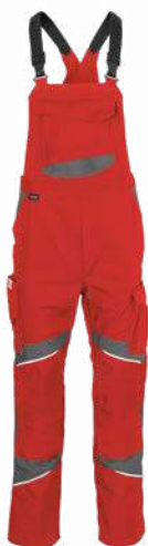
Mittelrot | Anthrazit 3450 3421-5597 40-66, 90-118, 23-31