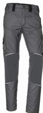
Anthrazit 2850 5231-97 40-66, 90-118, 23-31