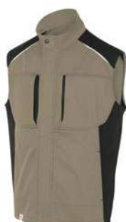
Sandbraun | Schwarz 7250 5365-2599 XS-4XL