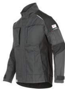
Anthrazit | Schwarz 1250 3421-9799 XS-4XL