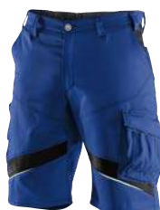
Kbl.blau | Schwarz 2450 5365-4699 40-66