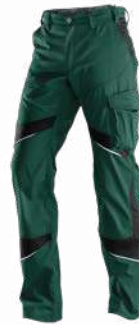
Moosgrün | Schwarz 2550 5365-6599 D34-D54