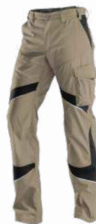
Sandbraun | Schwarz 2550 5365-2599 D34-D54