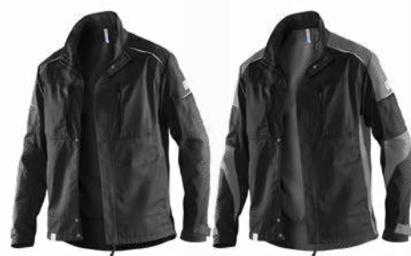
Schwarz 1250 5365-99 XS-4XL