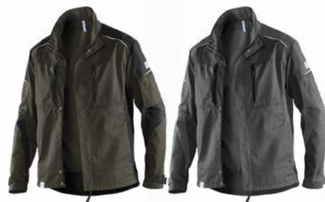
Oliv | Schwarz 1250 5365-6699 XS-4XL