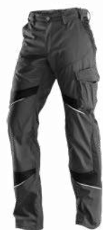
Anthrazit | Schwarz 2550 5365-9799 D34-D54