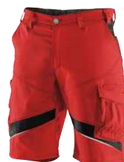
Mittelrot | Schwarz 2450 5365-5599 40-66