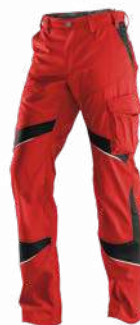
Mittelrot | Schwarz 2550 5365-5599 D34-D54