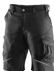
Schwarz 2450 5365-99 40-66