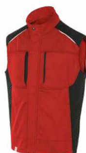
Mittelrot | Schwarz 7250 5365-5599 XS-4XL