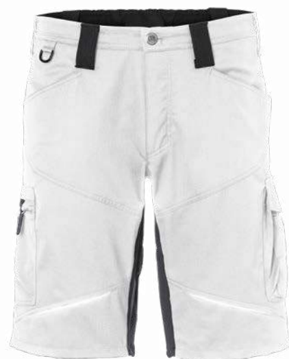
Weiß | Anthrazit 2950 5231-1097 40-64