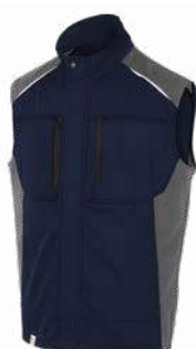
Dunkelblau | Anthrazit 7250 5365-4897 XS-4XL