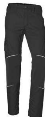
Schwarz 2850 5231-99 40-66, 90-118, 23-31