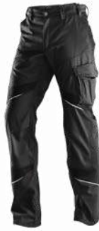
Anthrazit 2550 5365-97 D34-D54