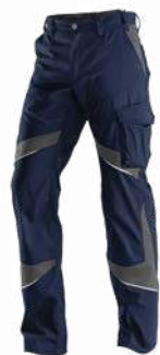
Dunkelblau | Anthrazit 2550 5365-4897 D34-D54