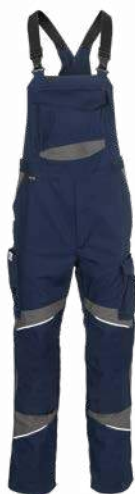
Dunkelblau | Anthrazit 3450 3421-4897 40-66, 90-118, 23-31