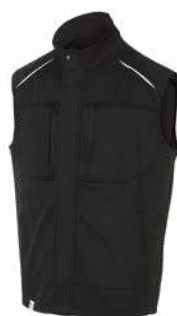
Schwarz 7250 5365-99 XS-4XL