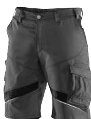
Anthrazit | Schwarz 2450 5365-9799 40-66