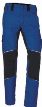
Kbl.blau | Schwarz 2850 5231-4699 40-66, 90-118, 23-31