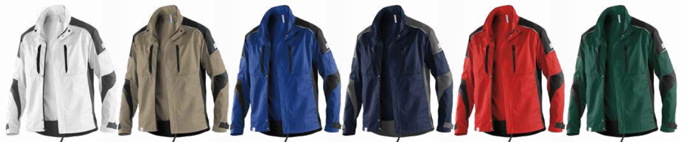
Weiß | Anthrazit 1250 5365-1097 XS-4XL