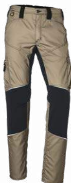
Sandbraun | Schwarz 2850 5231-2599 40-66, 90-118, 23-31