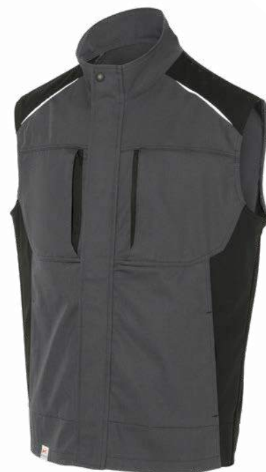
Anthrazit | Schwarz 7250 5365-9799 XS-4XL