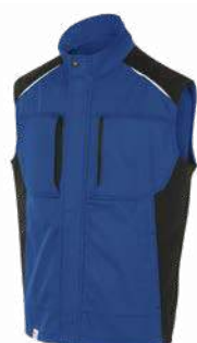
Kbl.blau | Schwarz 7250 5365-4699 XS-4XL