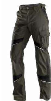
Oliv | Schwarz 2550 5365-6699 D34-D54