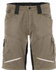
Sandbraun | Schwarz 2950 5231-2599 40-64