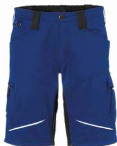
Kbl.blau | Schwarz 2950 5231-4699 40-64