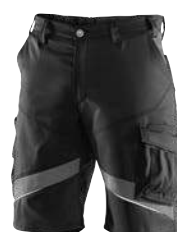
Schwarz | Anthrazit 2450 5365-9997 40-66