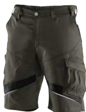
Oliv | Schwarz 2450 5365-6699 40-66