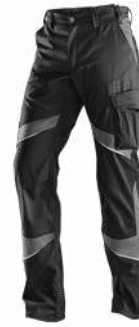
Schwarz | Anthrazit 2550 5365-9997 D34-D54