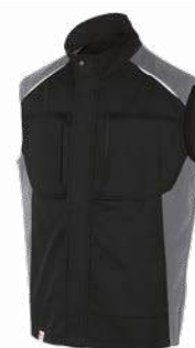
Schwarz | Anthrazit 7250 5365-9997 XS-4XL