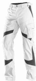
Weiß | Anthrazit 2550 5365-1097 D34-D54