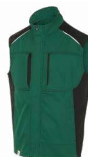
Moosgrün | Schwarz 7250 5365-6599 XS-4XL