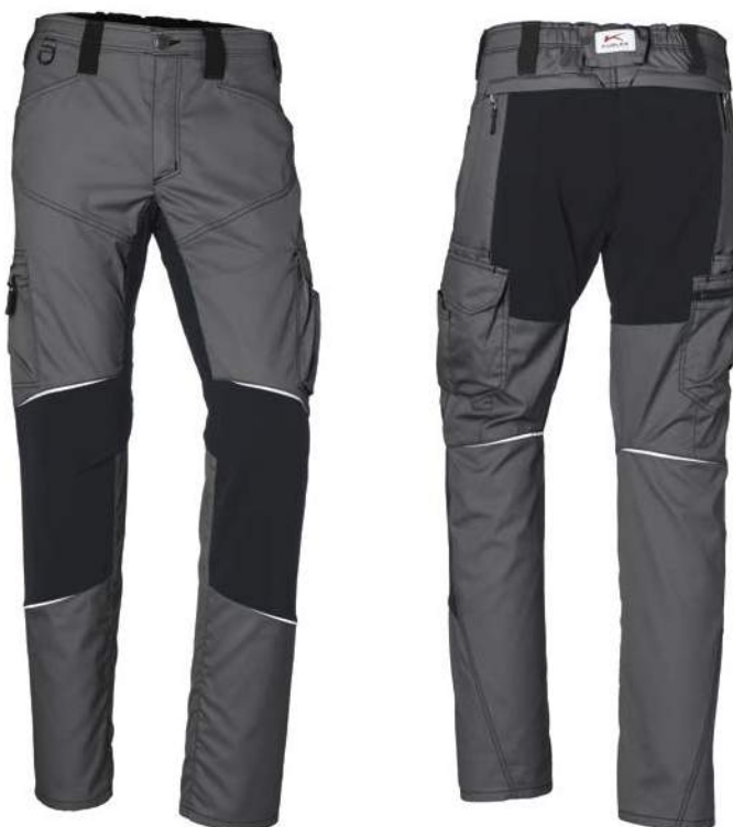
Anthrazit | Schwarz 2850 5231-9799 40-66, 90-118, 23-31