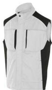
Weiß | Anthrazit 7250 5365-1097 XS-4XL