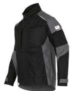
Schwarz | Anthrazit 1250 3421-9997 XS-4XL