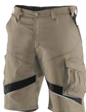
Sandbraun | Schwarz 2450 5365-2599 40-66