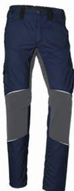
Dunkelblau | Anthrazit 2850 5231-4897 40-66, 90-118, 23-31