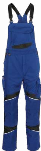
Kbl.blau | Schwarz 3450 3421-4699 40-66, 90-118, 23-31