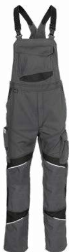
Anthrazit | Schwarz 3450 3421-9799 40-66, 90-118, 23-31