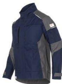
Dunkelblau | Anthrazit 1250 3421-4897 XS-4XL