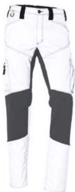
Weiß | Anthrazit 2850 5231-1097 40-66, 90-118, 23-31