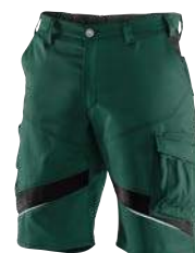
Moosgrün | Schwarz 2450 5365-6599 40-66