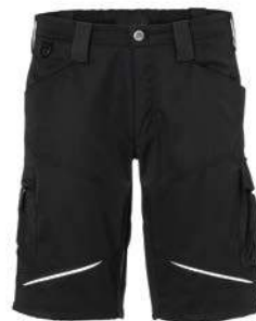
Schwarz 2950 5231-99 40-64