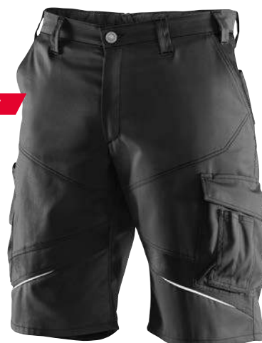
Schwarz 2650 5365-99 D34-D54