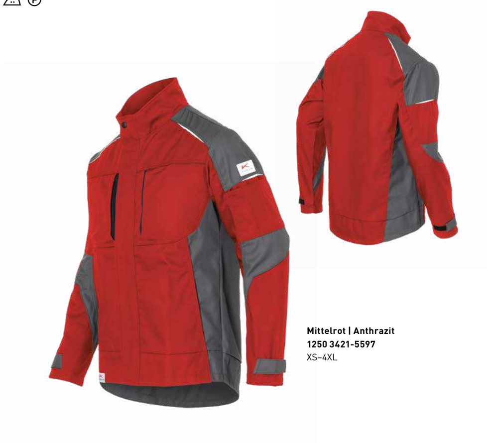
Mittelrot | Anthrazit 1250 3421-5597 XS-4XL