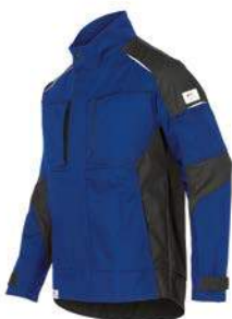
Kbl.blau | Schwarz 1250 3421-4699 XS-4XL